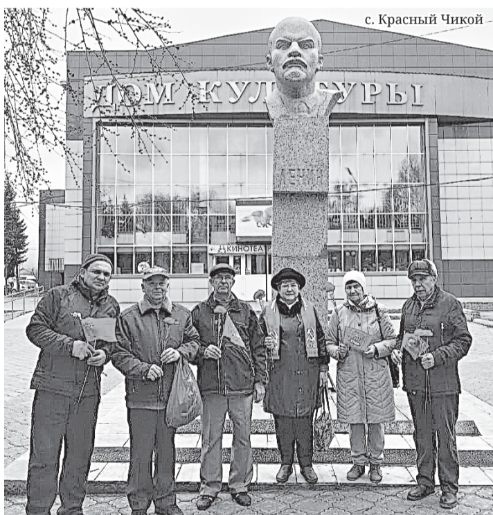
с. Красный Чикой

22 апреля коммунисты Забайкалья в разных уголках края почтили память Владимира Ильича. Фотографиями с мероприятий поделились секретари Шелопугинского, Кыринского, Красночикуйского, Карымского, Чернышевского, Дульдургинского и Петровск-Забайкальского местных отделений КПРФ.