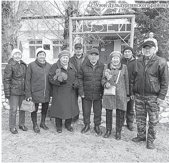
с. Узон Дульдургинского района