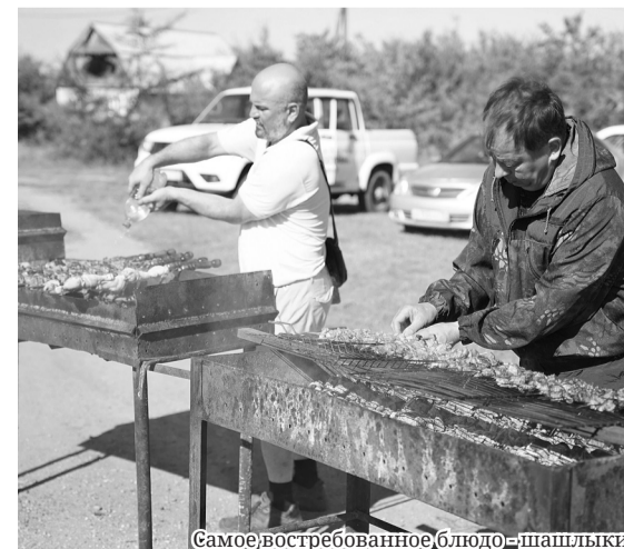
Самое востребованное блюдо - шашлыки