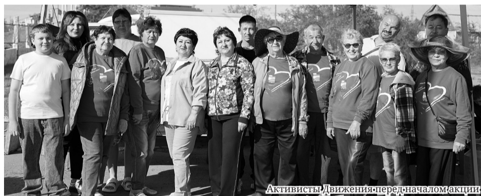
Активисты Движения перед началом акции

ЧЕТВЕРТЫЙ ГОД ИДЁТ СПЕЦИАЛЬНАЯ ВОЕННАЯ ОПЕРАЦИЯ. ЧЕТВЕРТЫЙ ГОД ВОЛОНТЁРСКОЕ ДВИЖЕНИЕ #МЫВМЕСТЕПРИАРГУНСКИЙОКРУГ ОКАЗЫВАЕТ ПОМОЩЬ ФРОНТУ. НЕ ОСТАЛИСЬ В СТОРОНЕ И КОММУНИСТЫ ПРИАРГУНСКОГО МЕСТНОГО ОТДЕЛЕНИЯ КПРФ. В ЭТОЙ ВОЛОНТЁРСКОЙ ГРУППЕ СОСТОИТ, ПРАКТИЧЕСКИ, ВСЯ НАША ПАРТИЙНАЯ ОРГАНИЗАЦИЯ ОКРУГА.