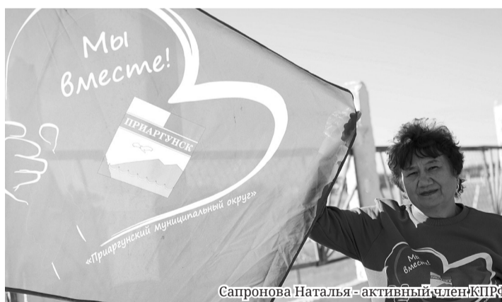
Сапронова Наталья - активный член КПРФ